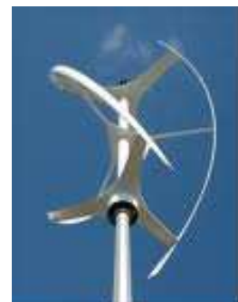
Turbina de eje vertical

Los aerogeneradores de eje vertical son de menor velocidad específica (relación entre