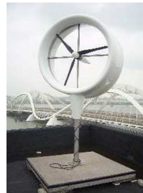
Aerogenerador tipo Venturi (Donq)

Los diseños de tipo Venturi aumentan la velocidad de paso del viento debido a la depresión que generan disminuyendo además el ruido producido. Los generadores son externos por inducción sin multiplicadores.