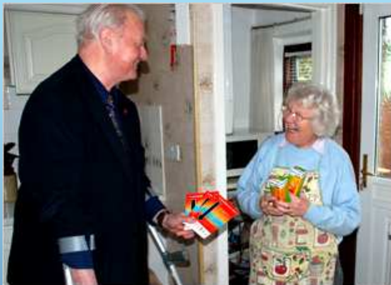
London Energy Challenge