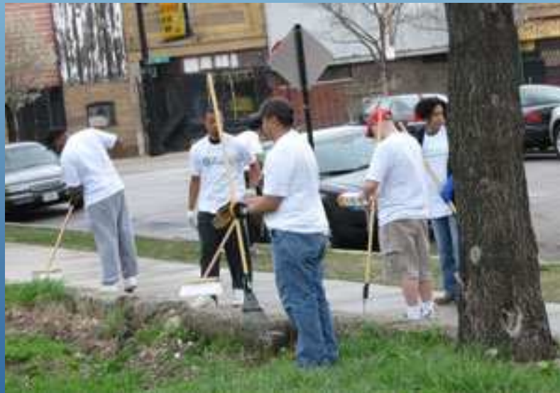
Chicago conservation corps

ZONAS VERDES Plantaciones Señalización Huertos urbanos Fauna y biodiversidad