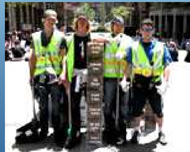
Sidney community garden