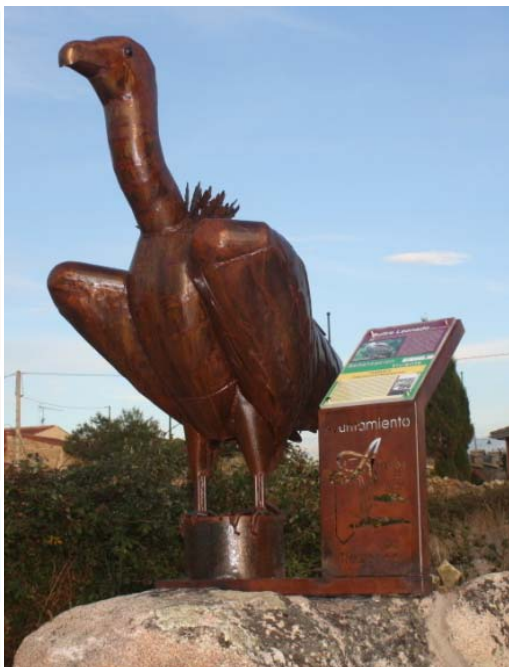
Fig – Buitre