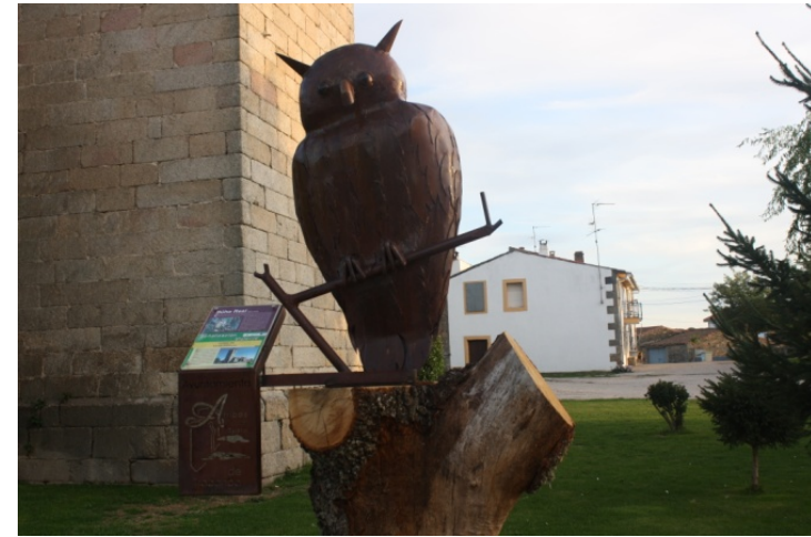
Fig – Buho