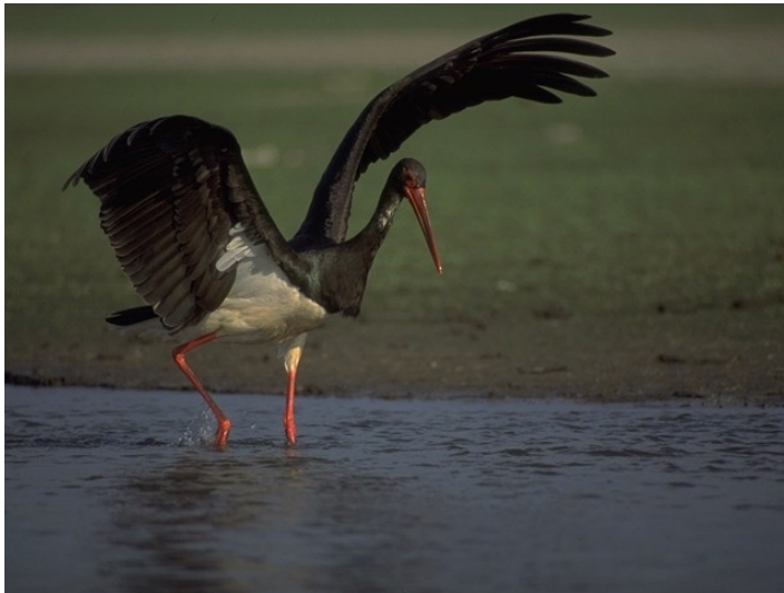
Fig – Cigüeña negra