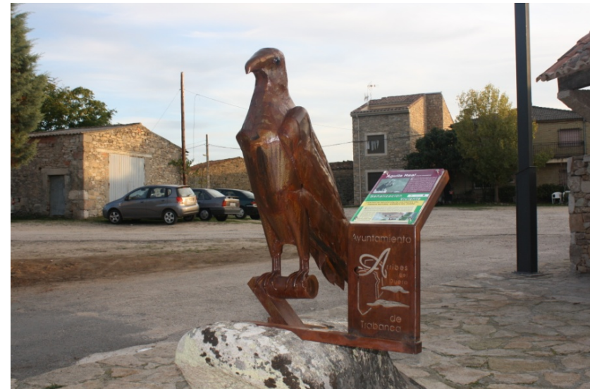
Fig – Aguila Real