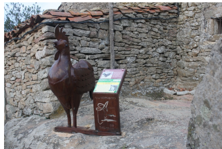
Fig – Gallo