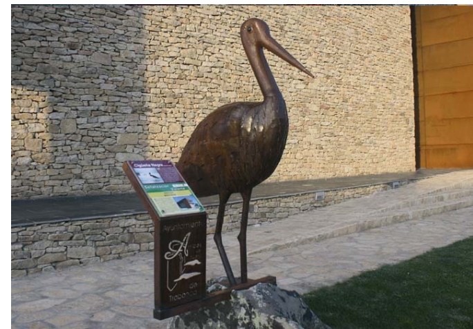
Fig – Parque Natural Arribes del Duero y Cigüeña negra