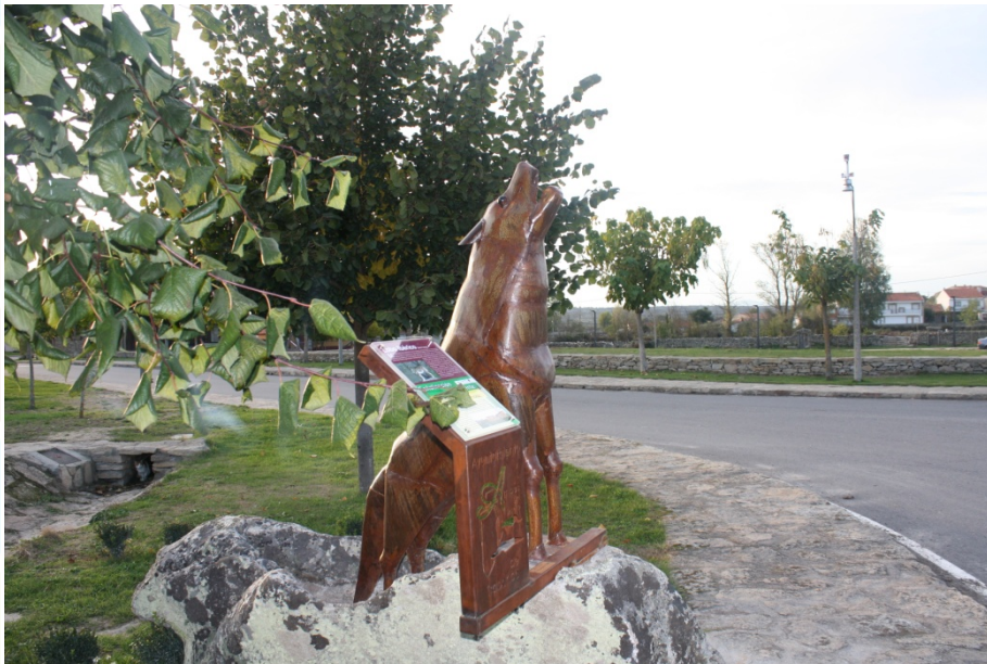
Fig – Lobo