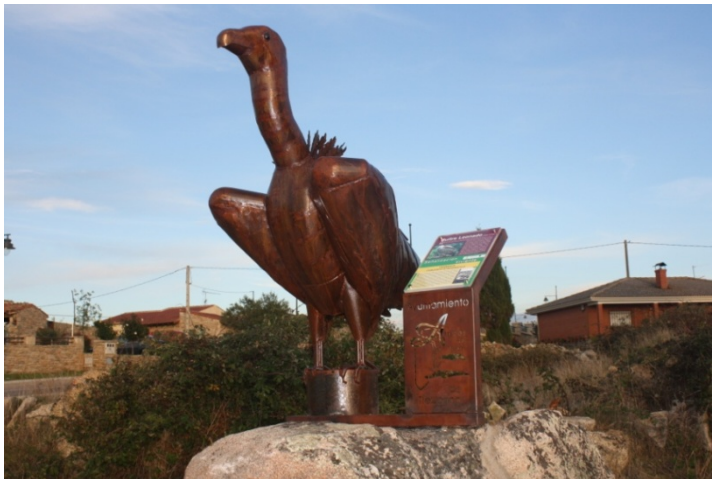
Fig – Buitre

Salvaguardar el medio ambiente. . . Es un principio rector de todo nuestro trabajo en el apoyo del desarrollo sostenible.” Kofi Annan