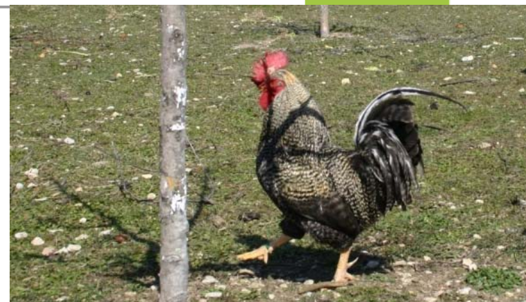
Fig – Gallo