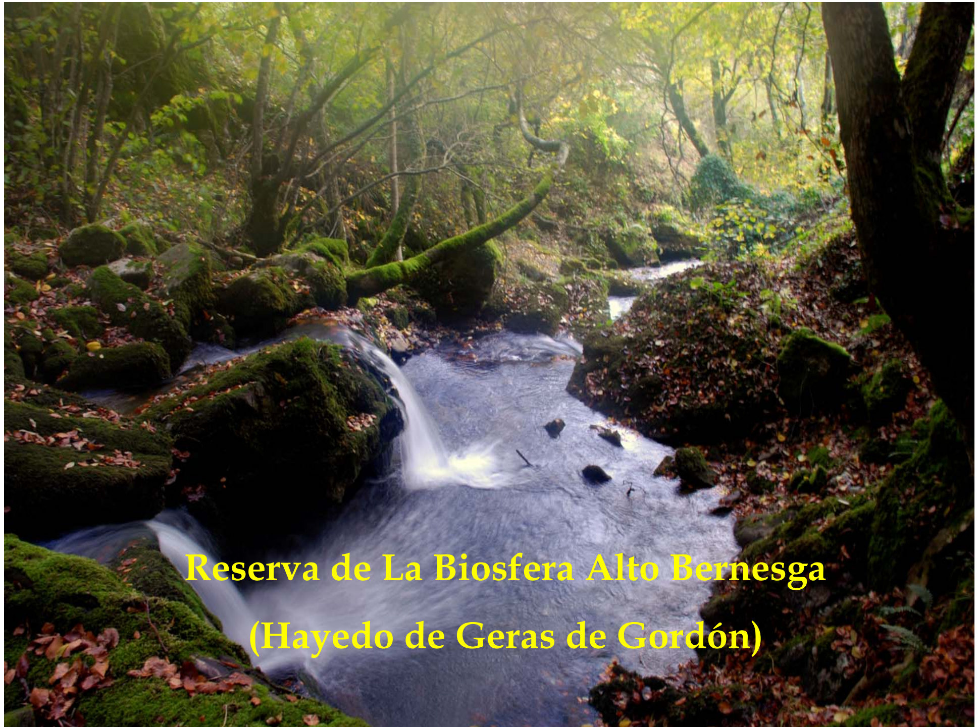
Reserva de La Biosfera Alto Bernesga (Hayedo de Geras de Gordón)